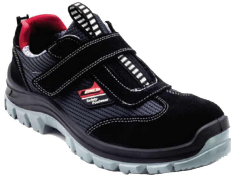
EMEX MİLANO SA 1070 S1