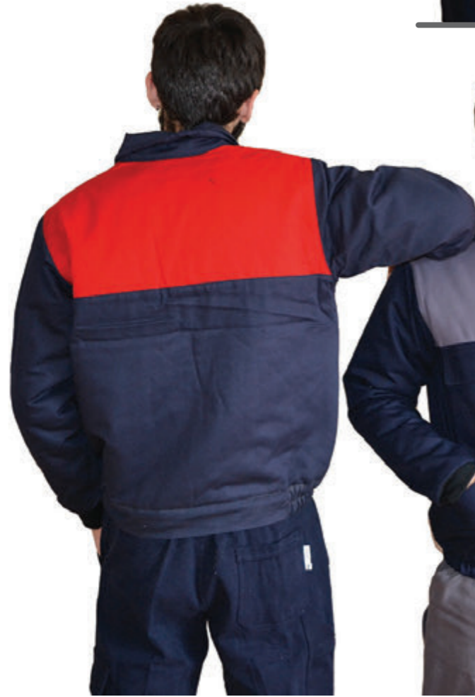
ÜRÜN KODU: İŞ-48