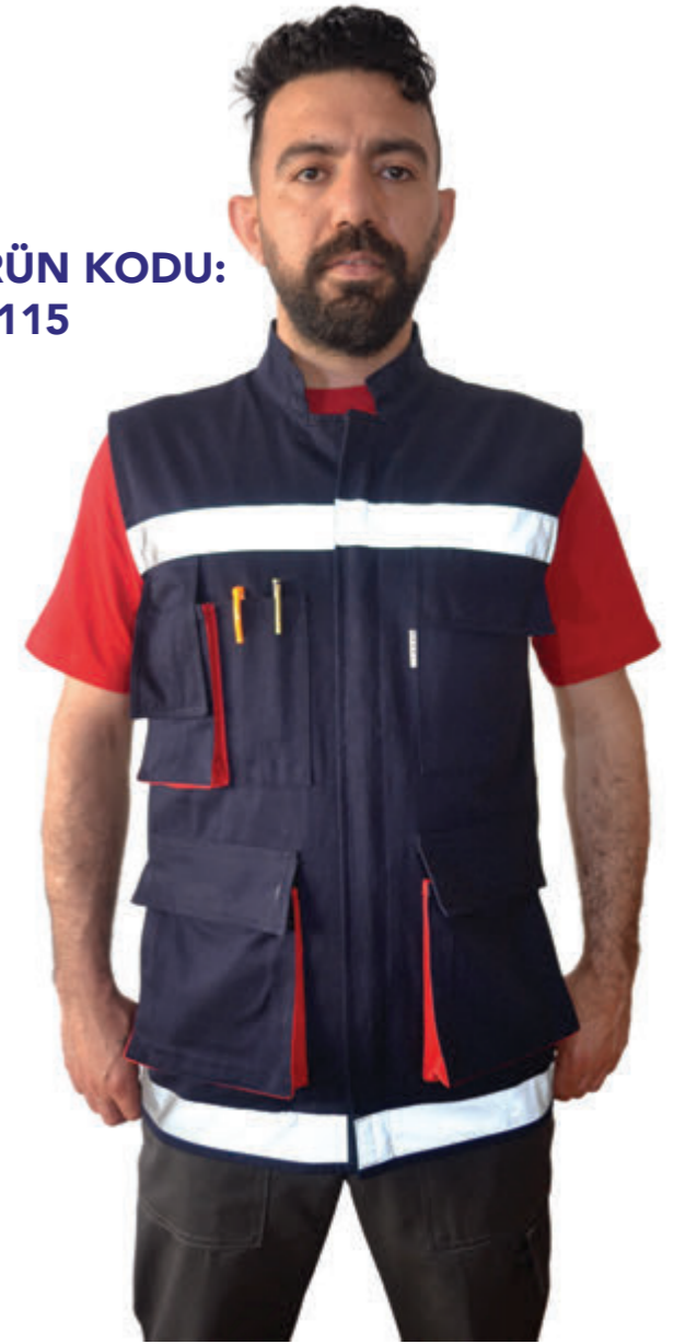
ÜRÜN KODU: İŞ-115