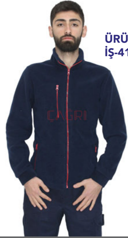
ÜRÜN KODU: İŞ-41