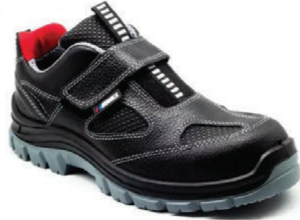
EMEX M1020 BASKILI DERİ S1