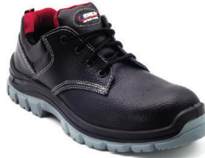
EMEX M90 S2