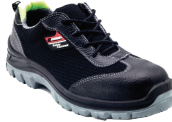
EMEX MİLANO CİRTLİ CİLT DERİ