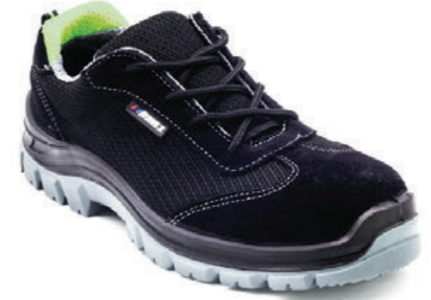
EMEX MİLANO SB 1070 S1