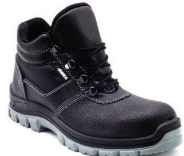
EMEX M1090 S2