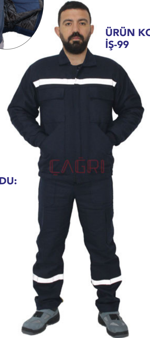
ÜRÜN KODU: İŞ-99