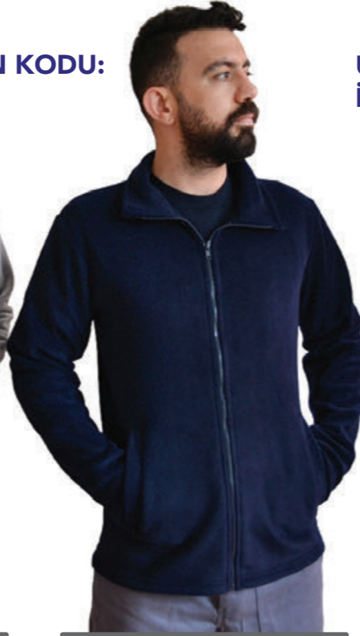
ÜRÜN KODU: İŞ-43