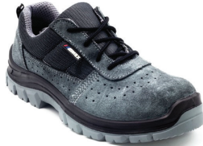
EMEX MADRİDS 1030 S1