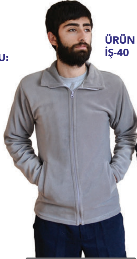
ÜRÜN KODU: İŞ-40