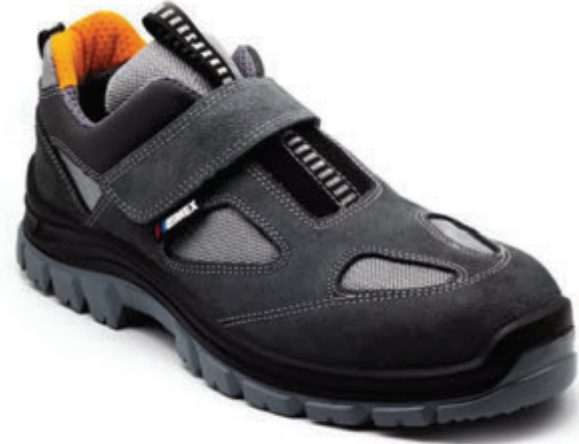
EMEX M1020 S1